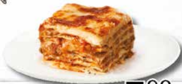
Lasagne al Forno al kg.

Porta a casa tutto il buono di un prodotto cucinato con cura dai nostri cuochi