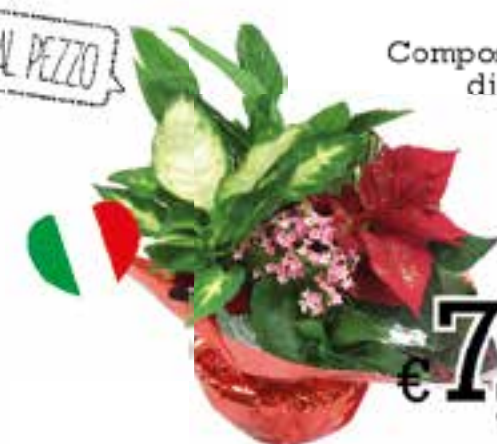
Composizione di Natale