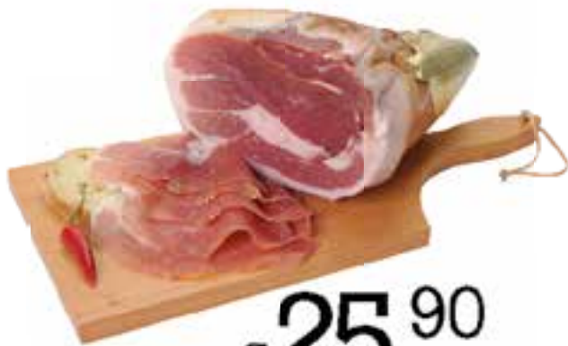
Prosciutto di Parma 24 mesi al kg. €25,90