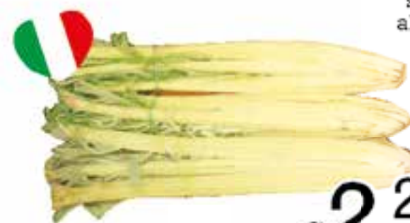
Cardi sfusi al kg.