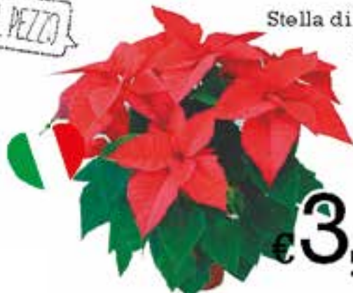
Stella di Natale media