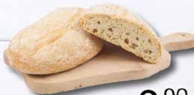
Pane Tipo 0 Acqua al kg.