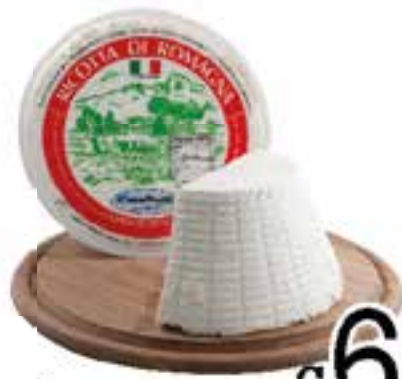
Ricotta Romagna Mambelli al kg.