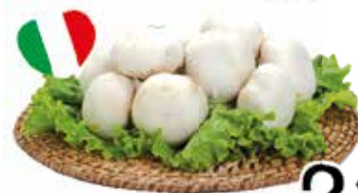
Funghi Champignon Fiorone sfusi al kg.