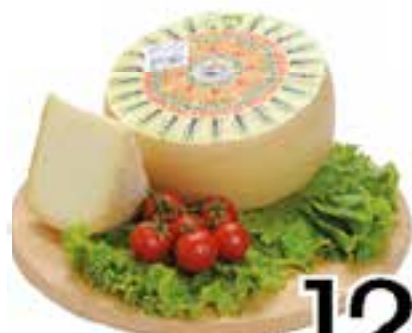
Pecorino Sardo dolce dop al kg.