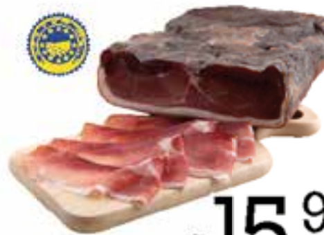
Speck Alto Adige Senfter igp al kg.