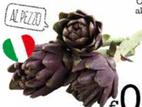
Carciofi al pezzo