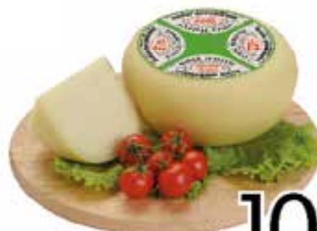
Misto Poggi Italiani al kg.