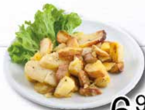
Patate al Forno al kg.