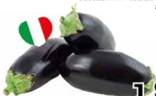
Melanzane tonde sfuse al kg.