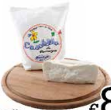
Casatella Mambelli al kg.