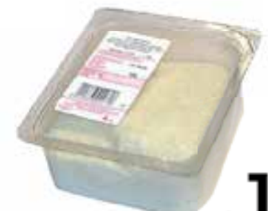
Mix formaggi grattugiati gr. 150