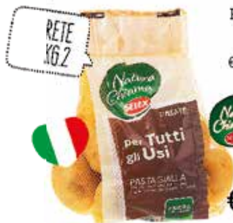
Patate Tutti gli Usi Selex rete kg. 2 € 1,78 al pezzo