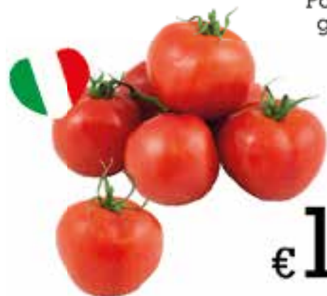
Pomodoro grappolo sfuso al kg.