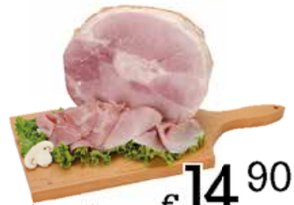
Prosciutto cotto Nazionale Alta Qualità Coai al kg.