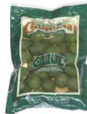
Olive giganti in salamoia busta gr. 300