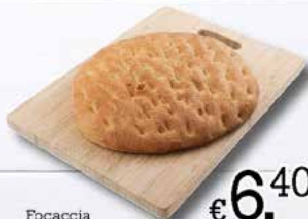
Focaccia Montanara al kg.