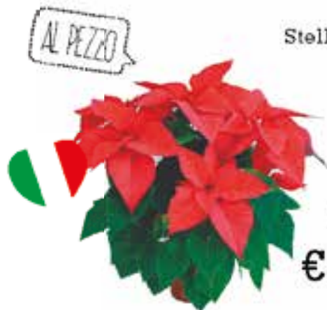
Stelle di Natale piccole