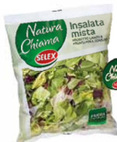
Insalata Mista Natura Chiama Selex busta gr. 350