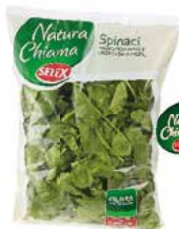
Spinaci Natura Chiama Selex busta gr. 500