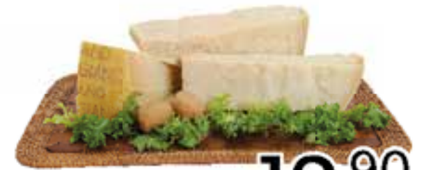
Parmigiano Reggiano gr. 500 circa al kg. €12,90