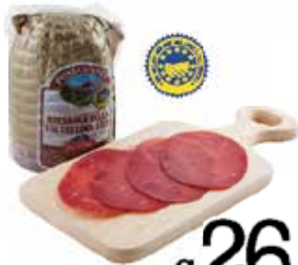
Bresaola punta d'anca IGP al kg.