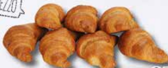
Croissant Integrale ai Frutti di Bosco