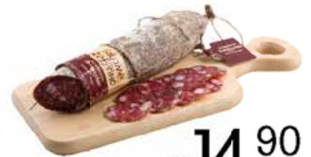
Salame Zeffrino Del Vecchio al kg.