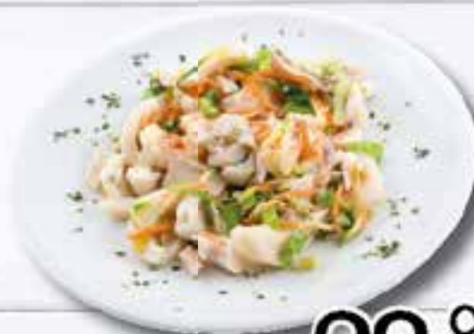
Insalata di Mare al kg.